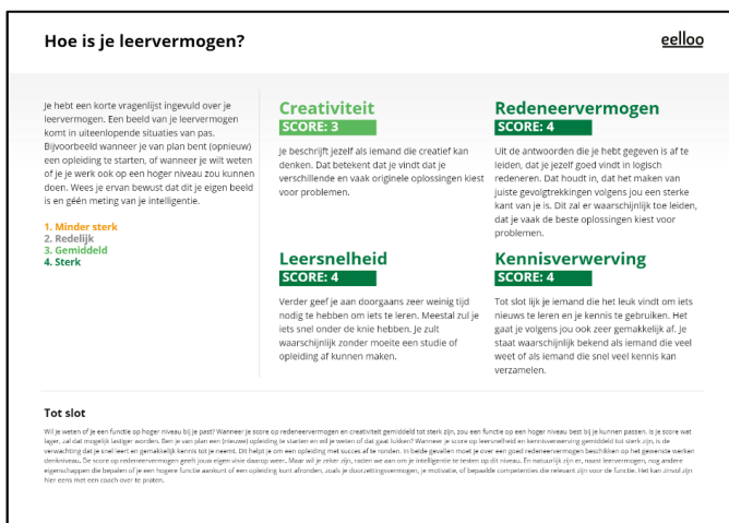
Voorbeeldrapport Hoe is je leervermogen?