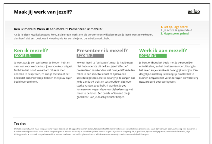
Voorbeeldrapport Maak jij werk van jezelf?